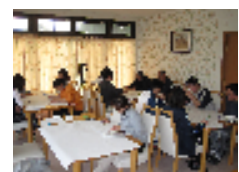
内部勉強会の様子